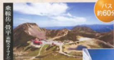
乗鞍岳・豊平乗鞍(ララ)

●マイカー/平湯温泉バスターミナルより約30分(バスは約30分おきに運行、往復大人:2000円)