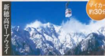
新穂高ロープウェイ

●マイカー/平湯温泉より約80分(JR高山駅・高山遺飛バスセンターより直通路線バス運行)